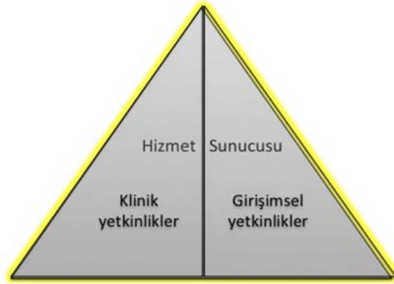
Şekil 2- TUKMOS yedinci temel yetkinlik alanı: Hizmet Sunucusu

Girişimsel Yetkinlik: Bilgiyi, kişisel, sosyal ve/veya metodolojik becerileri tıbbi girişimler konusunda kullanabilme yeteneğidir.